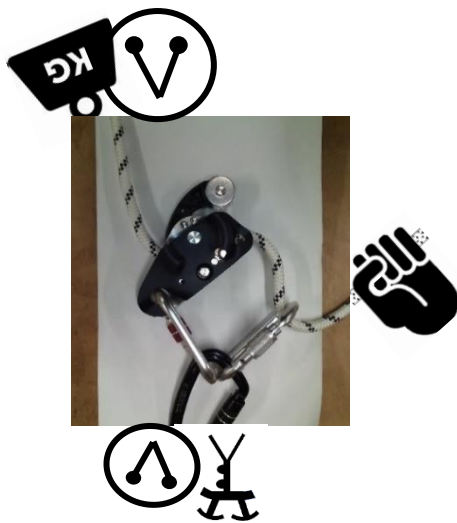
Bottom anchorage or descent Ancrage bas ou descente à 2

Pourtant, en sauvetage Taz autorise du matériel et des techniques ajoutées à la notice, pour la compléter.